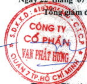
Trương Thành Nhân