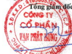
Trương Thành Nhân